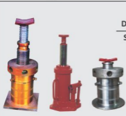
Double Lift Screw Jack Single Lift Screw Jack